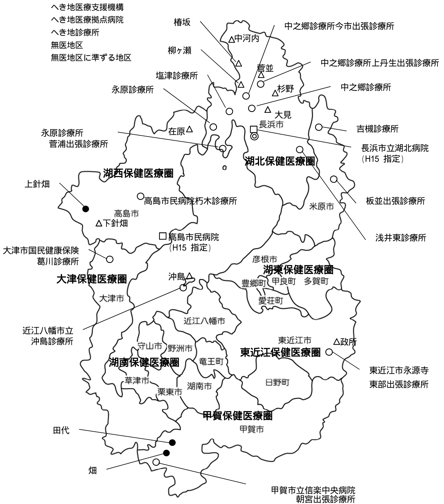
表 3 - 3 - 10 - 4 へき地保健医療対策現況図 (平成 29 年 (2017 年))